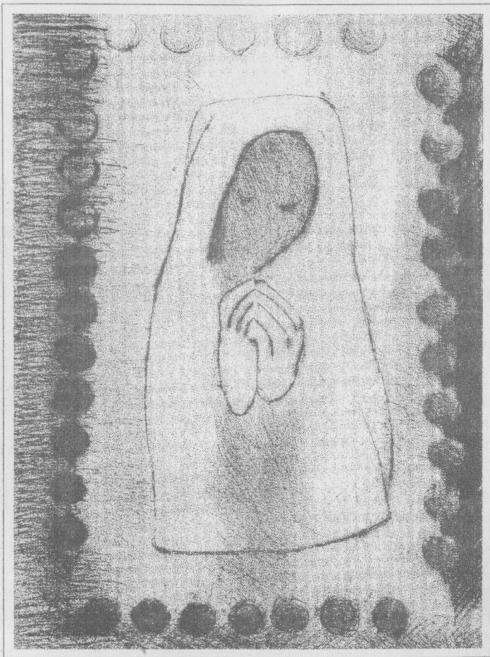
L. Jandová – Panna Maria růžencová

Vše zná, vše žila – kromě hříchů. I lidský pláč, jenž do kalichů tvář pravou teprv leptá všem. Přes vlny žalů Panna svatá za každým ze svých dětí chvátá, pod srdcem s živým Ježíšem.